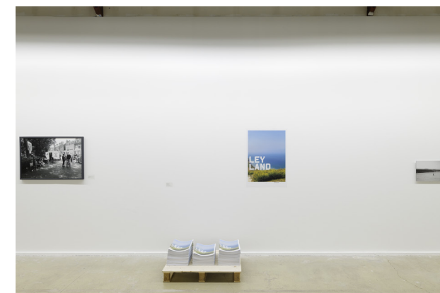
Vue de l'exposition Réinventer Calais , CPIF, 2019 © Aurélien Mole / CPIF.