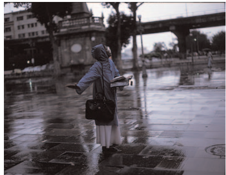
Sans titre , 2006-7, 125 x 170 cm, photographie couleur.