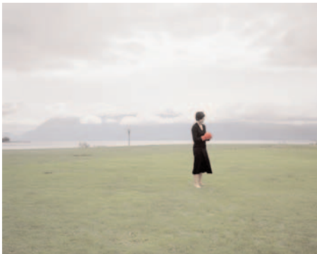
Gant rouge , 2005, 120 x 160 cm, photographie couleur.