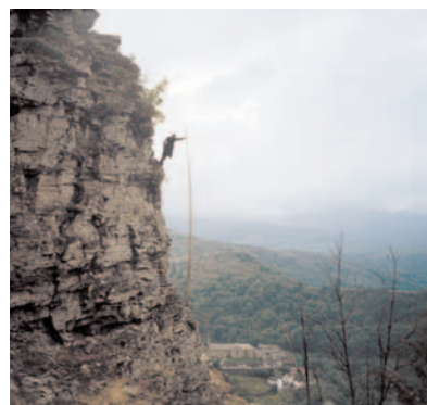
Lozère 3 , 2005, 60 x 60 cm, photographie couleur.