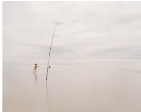
Canne à pêche , 2000, 120 x 160 cm, photographie couleur.