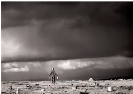
Encre 2 , 2007, 95 x 66cm, photographie couleur.