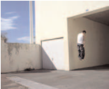
Sans titre n°11 , 2007, 85 x 105 cm, photographie couleur.