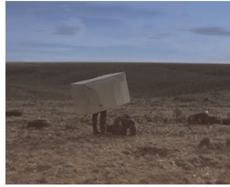
Box , video installation, 2003, © Sebastian Diaz-Morales, Courtesy Galerie Carlier / Gebauer, Berlin