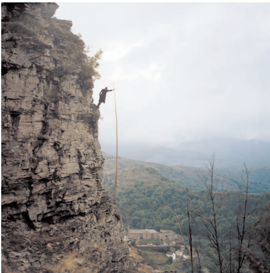
Lucien Pelen, Lozère 3 , 2005, 60 x 60 cm, photographie couleur.

EXPOSITION PRÉSENTÉE DU 23 JANVIER AU 22 MARS VERNISSAGE LE MARDI 22 JANVIER À PARTIR DE 19H30