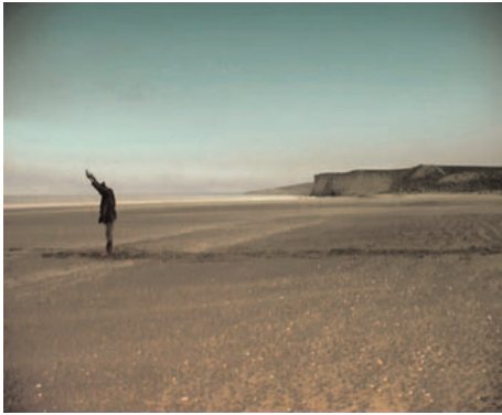
Force , video installation, 2003, © Sebastian Diaz-Morales, Courtesy Galerie Carlier / Gebauer, Berlin