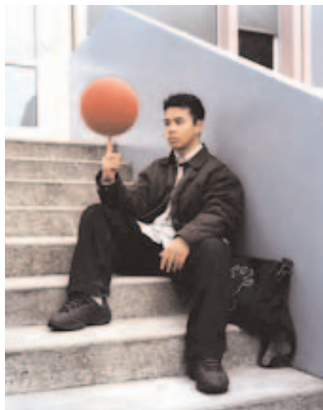
Sans titre , 2000, série « Montreuil », 100 x 80 cm, photographie couleur.