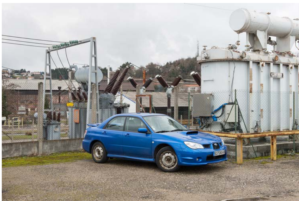
Nicolas Giraud et Bertrand Stoffleth, La Vallée, Transformateur électrique haute tension, c. 1970 — Subaru Impreza WRX STi, pneus neige, 2016 — Saint-Étienne, tirage baryté jet d'encre contrecollé dibond, 46 x 64 cm