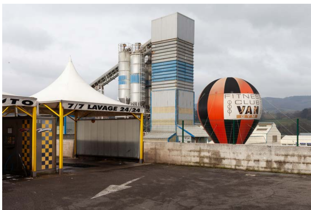
Nicolas Giraud et Bertrand Stofleth, La Vallée , Station de lavage automobile, club de remise en forme et centrale à béton, 2015 – L'Homme, tirage baryté jet d'encre contrecollé dibond, 64 x 91 cm, courtesy Giraud-Stofleth, © Adagp, Paris, 2022