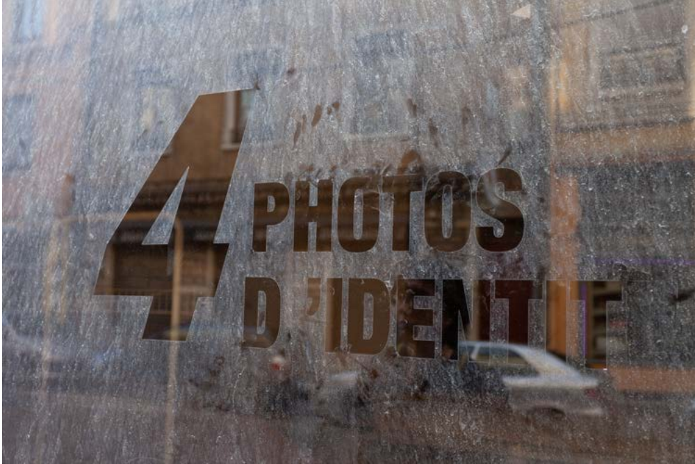
Nicolas Giraud et Bertrand Stofleth, La Vallée , Vitrine, 2014 — Oullins, tirage baryté jet d'encre contrecollé dibond, 46 x 64 cm, courtesy Giraud-Stofleth, © Adagp, Paris, 2022