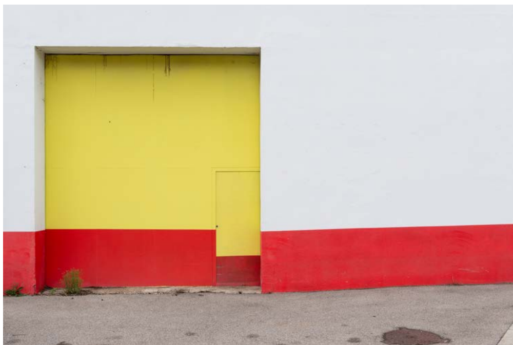
Nicolas Giraud et Bertrand Stofleth, La Vallée , Rue René Descartes, bâtiment industriel, 2014 — Saint-Etienne, tirage baryté jet d'encre contrecollé dibond, 64 x 91 cm, courtesy Giraud-Stofleth, © Adagp, Paris, 2022

D'autres visuels pourront également être mis à votre disposition sur demande.