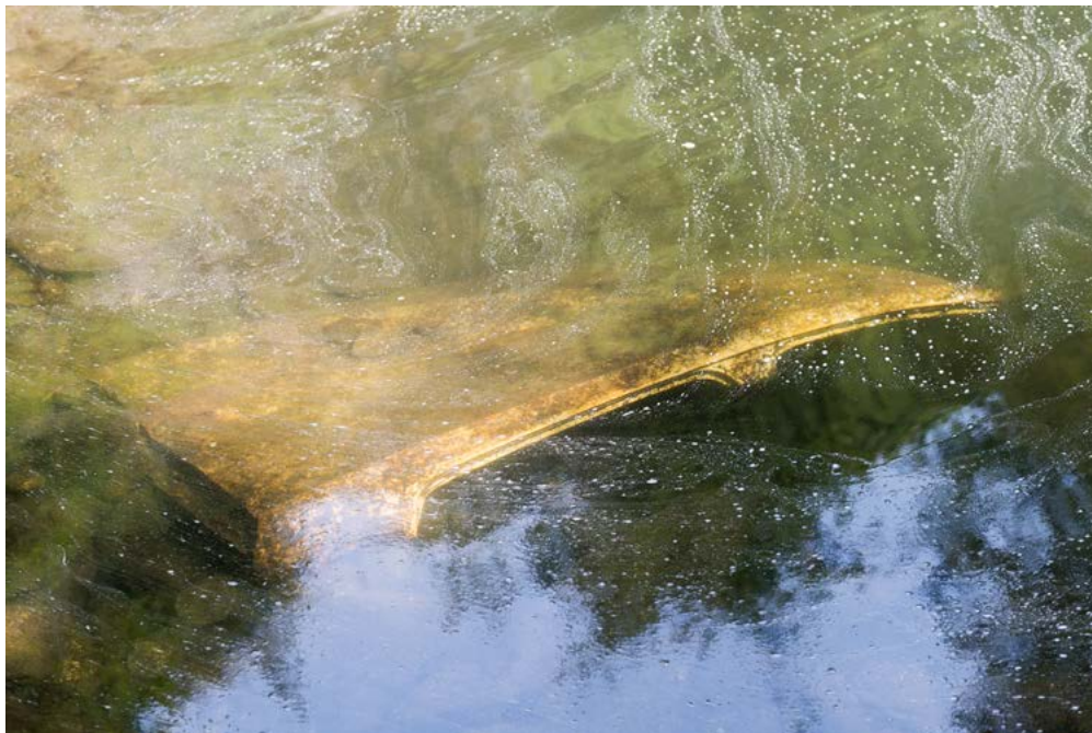
Nicolas Giraud et Bertrand Stofleth, La Vallée , Barrage du Dorlet, mise en eau, 1973 — Toit de voiture immergé, non daté, La-Terrasse-sur-Dorlet, tirage baryté jet d'encre contrecollé dibond, 64 x 91 cm, courtesy Giraud-Stofleth, © Adagp, Paris, 2022