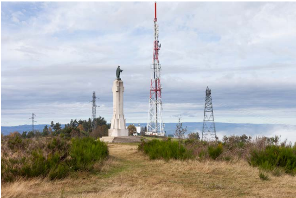
Nicolas Giraud et Bertrand Stofleth, La Vallée , Statue du Christ réalisée en métal (13 m), 1934 — Émetteur hertzien (42 m) et transmetteur TDF (110 m), c. 1960 — Saint-Étienne, tirage baryté jet d'encre contrecollé dibond, 64 x 91 cm, courtesy Giraud-Stofleth, © Adagp, Paris, 2022