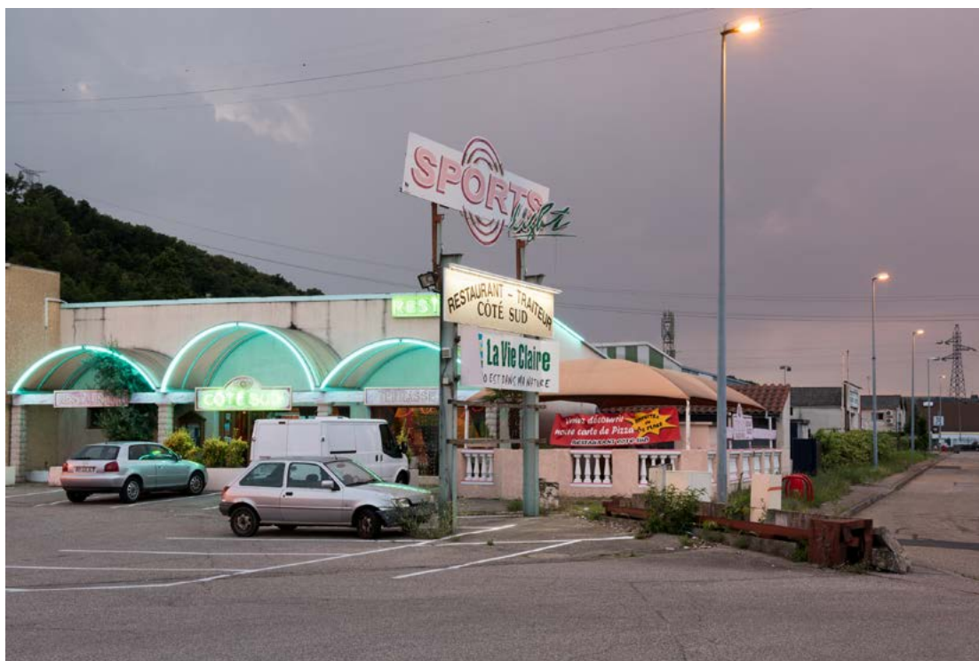
Nicolas Giraud et Bertrand Stofleth, La Vallée , Zone commerciale 2 Vallées, 1976 — Givors, tirage baryté jet d'encre contrecollé dibond, 64 x 91 cm, courtesy Giraud-Stofleth, © Adagp, Paris, 2022