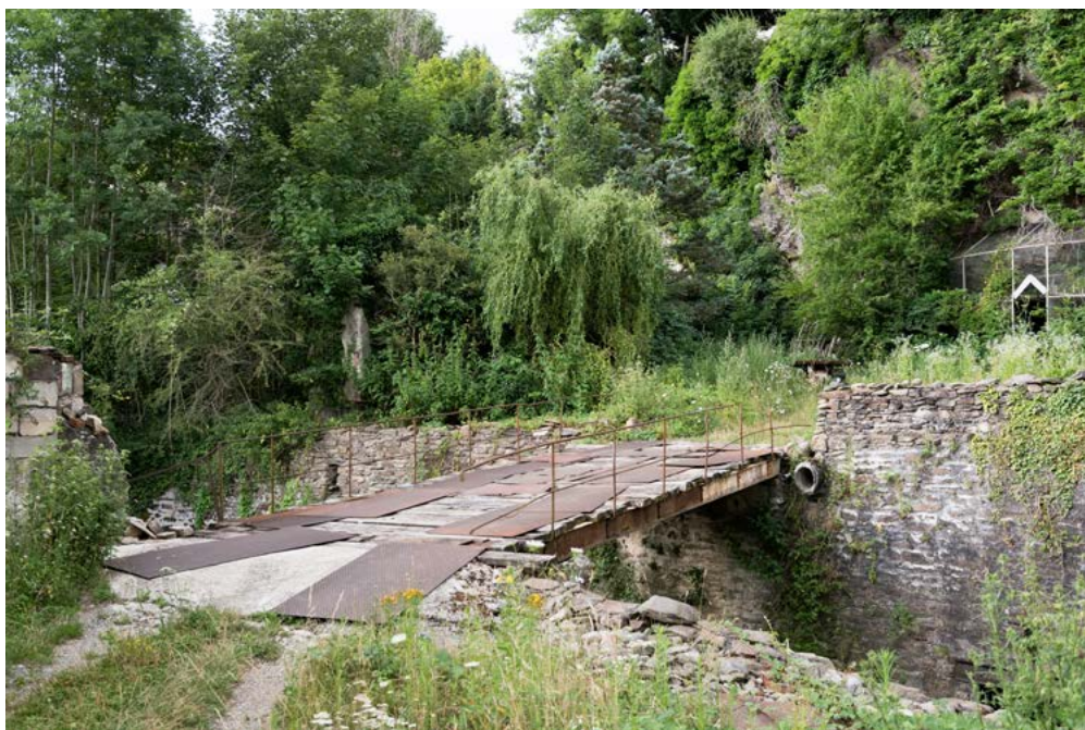
Nicolas Giraud et Bertrand Stofleth, La Vallée , Pont reliant un ancien moulinage à une maison de maître, non daté, La-Terrasse-sur-Dorlet, tirage baryté jet d'encre contrecollé dibond, 46 x 64 cm