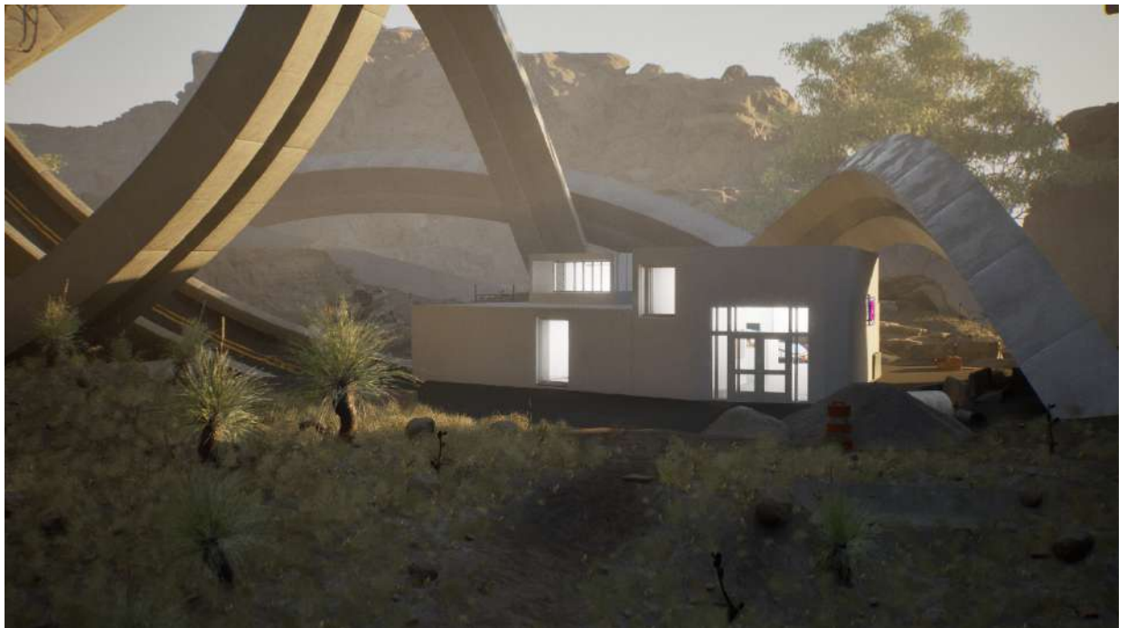
François Bellabas, EFLA-Dust Reboot 2.0 (détail), 2024, installation interactive, © Adagp, Paris, 2024, courtesy del'artiste

Au sein d'un paysage désertique remodulable à l'infini, divers objets et sculptures sont déployés, ainsi qu'un bâtiment improbable aux allures de white cube . Ce dernier, modelé d'après le Centre Photographique de Marseille (CPM), représente l'unique constante dans un monde où chaque nouvelle session enclenche un reboot . En adoptant le point de vue de la caméra, les visiteuses sont invité-es à arpenter cet espace et à contempler un milieu qui évolue à chaque activation, donnant accès à des configurations multiples.