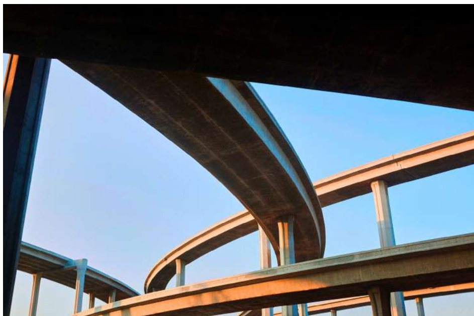
François Bellabas, DATABASE_Blindshot_005 , 2016, tirage jet d'encre pigmentaire, 100 x 150 cm, © Adagp, Paris, 2024, courtesy de l'artiste

D'autres vues, également extraites de cette collection, prennent la forme de tirages photographiques donnant à voir un détail de carrosserie, un échangeur autoroutier, des reflets de vitre ou un entrepôt de pneus. Sélectionnées par l'artiste, elles opèrent comme des "portails", donnant accès à une réflexion qui se développe à travers la création de formes photographiques en mutation. Réaffirmant la continuité entre le monde physique et virtuel, les œuvres de François Bellabas peuvent exister en tant qu'objets numériques ou concrets suivant des configurations variables.