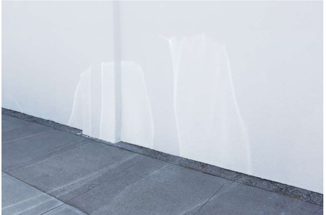
François Bellabas, MS_DATABASE_Shadowlight_001 , 2016, tirage jet d'encre pigmentaire, 60 x 90 cm, © Adagp, Paris, 2024, courtesy de l'artiste