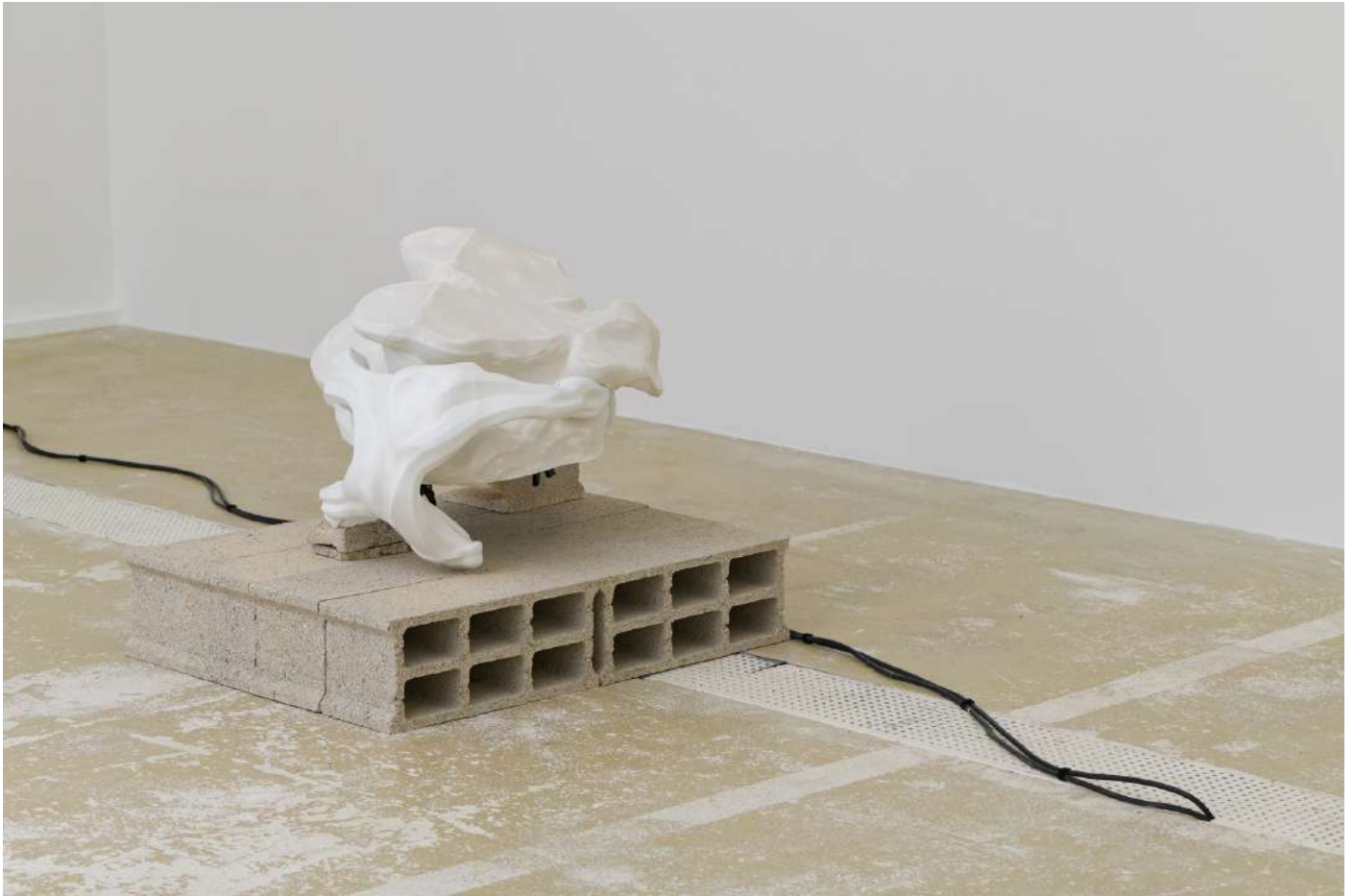
François Bellabas, Bloombyte System , impression 3D, 2024, © Adagp, Paris, 2024, courtesy de l'artiste

d'un environnement digital, elles donnent à voir des anatomies hybrides, à la fois organiques et artificielles.