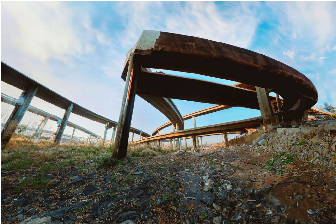
François Bellabas, MOTORSTUDIES_DATABASE_Blindshot_005_Iteration-002 , 2024, tirage jet d'encre sur aquapaper, 4 x 6 m, © Adagp, Paris, 2024, courtesy del'artiste

Les visuels du présent dossier sont disponibles sur demande à francesco.biasi@cpif.net Ils peuvent être utilisés dans le cadre de la couverture presse de l'exposition Blank Memory , visible au CPIF du 27 avril au 21 juillet 2024.