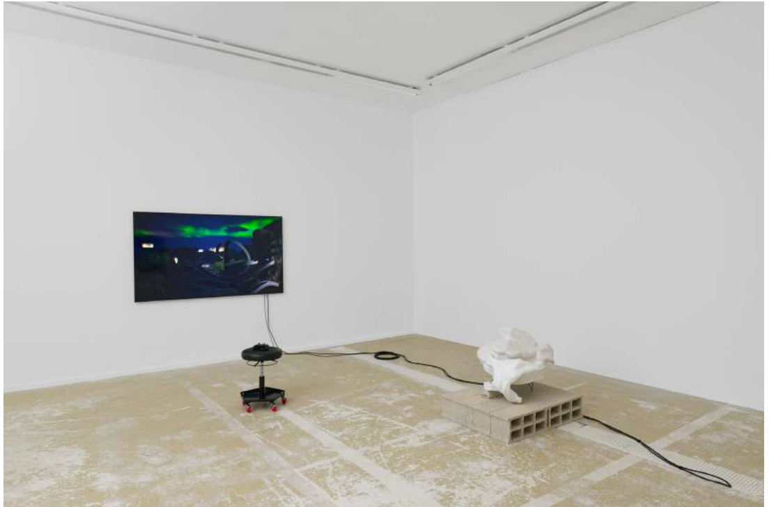
François Bellabas, EFLA-Dust Reboot 2.0 , 2024, installation interactive, © Adagp, Paris, 2024, courtesy del'artiste