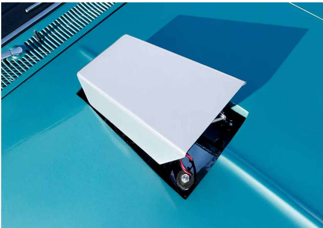
François Bellabas, MOTORSTUDIES_Powerform_009 , 2016, tirage jet d'encre pigmentaire, 100 x 150 cm, © Adagp, Paris, 2024, courtesy de l'artiste

(fermetures exceptionnelles les 18 et 19 mai, et le 21 juin)