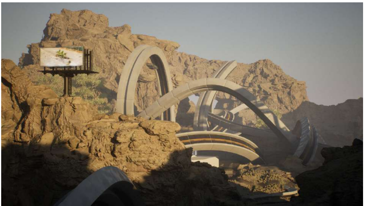
François Bellabas, EFLA-Dust Reboot 2.0 , (détail), 2024, installation interactive, © Adagp, Paris, 2024, courtesy del'artiste