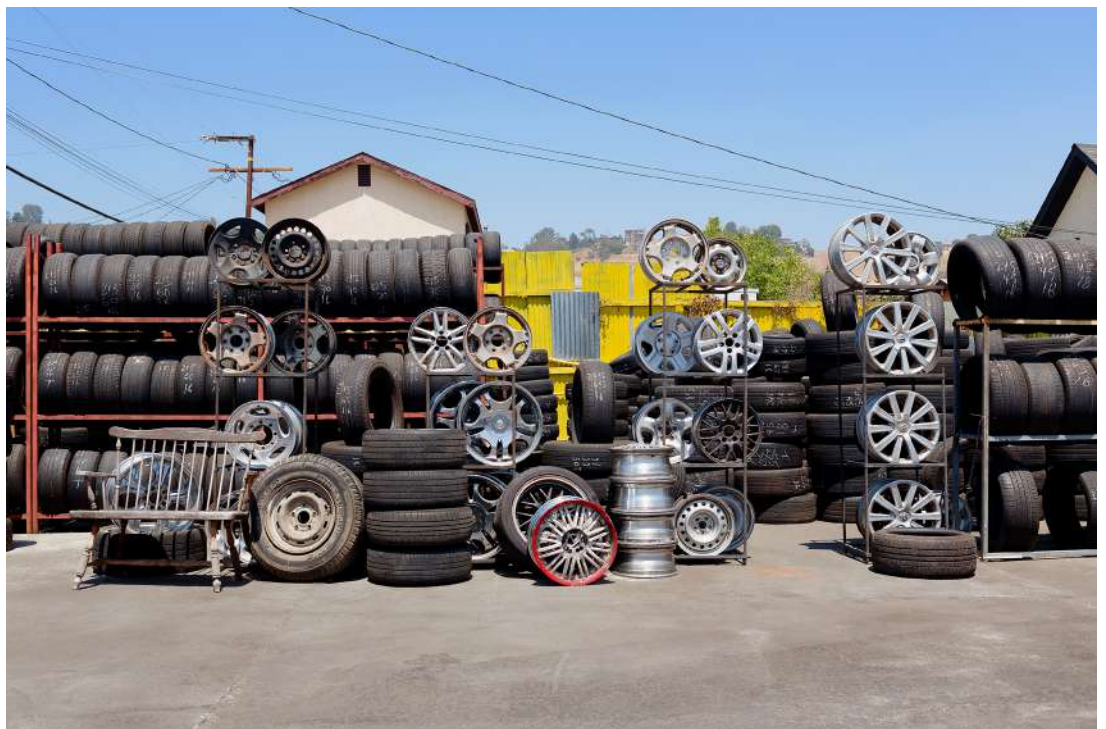
François Bellabas, MS_DATABASE_City_032 , 2016, tirage jet d'encre pigmentaire, 100 x 150 cm, © Adagp, Paris, 2024, courtesy de l'artiste