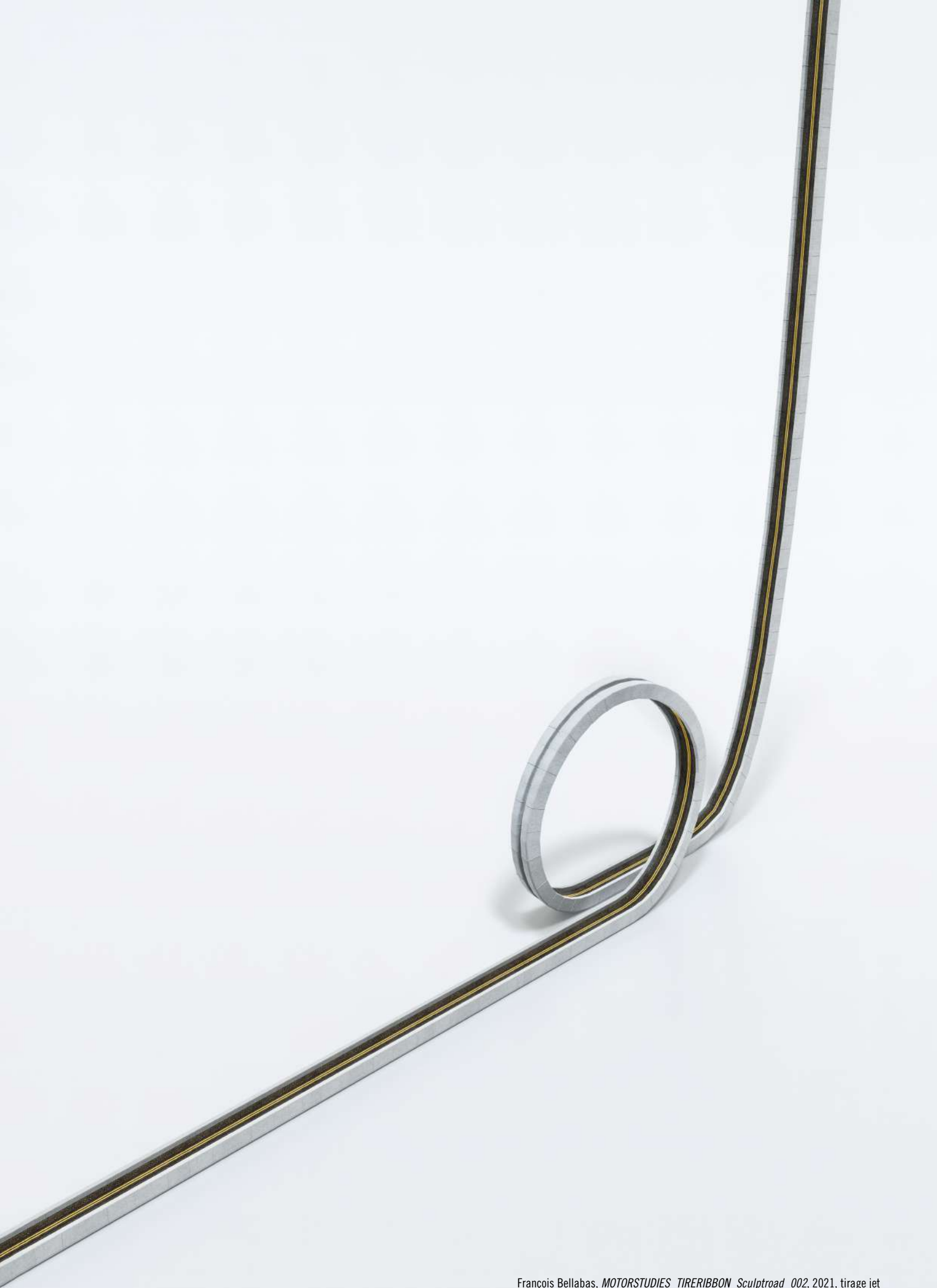
François Bellabas, MOTORSTUDIES_TIRERIBBON_Sculptroad_002 , 2021, tirage jet d'encre pigmentaire, 121 x 90 cm, © Adagp, Paris, 2024, courtesy de l'artiste