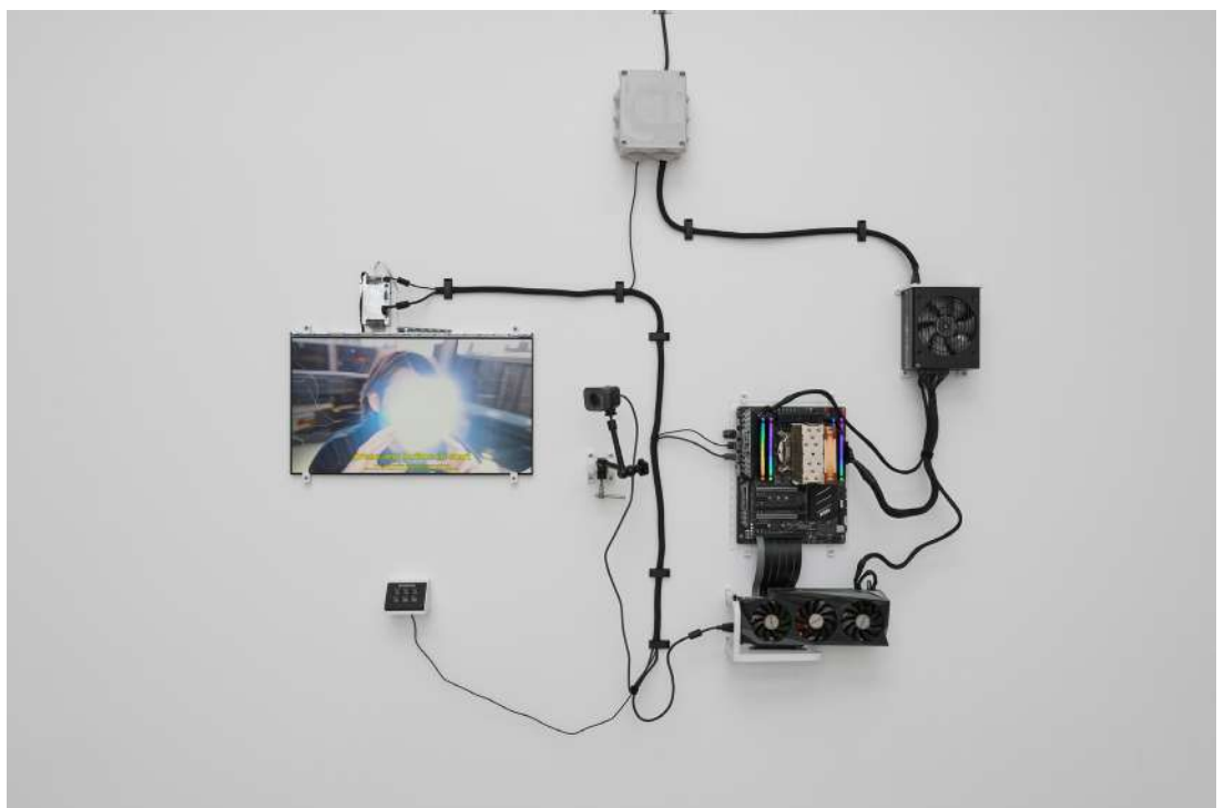
François Bellabas, Protomaton , 2024, installation interactive, © Adagp, Paris, 2024, courtesy de l'artiste