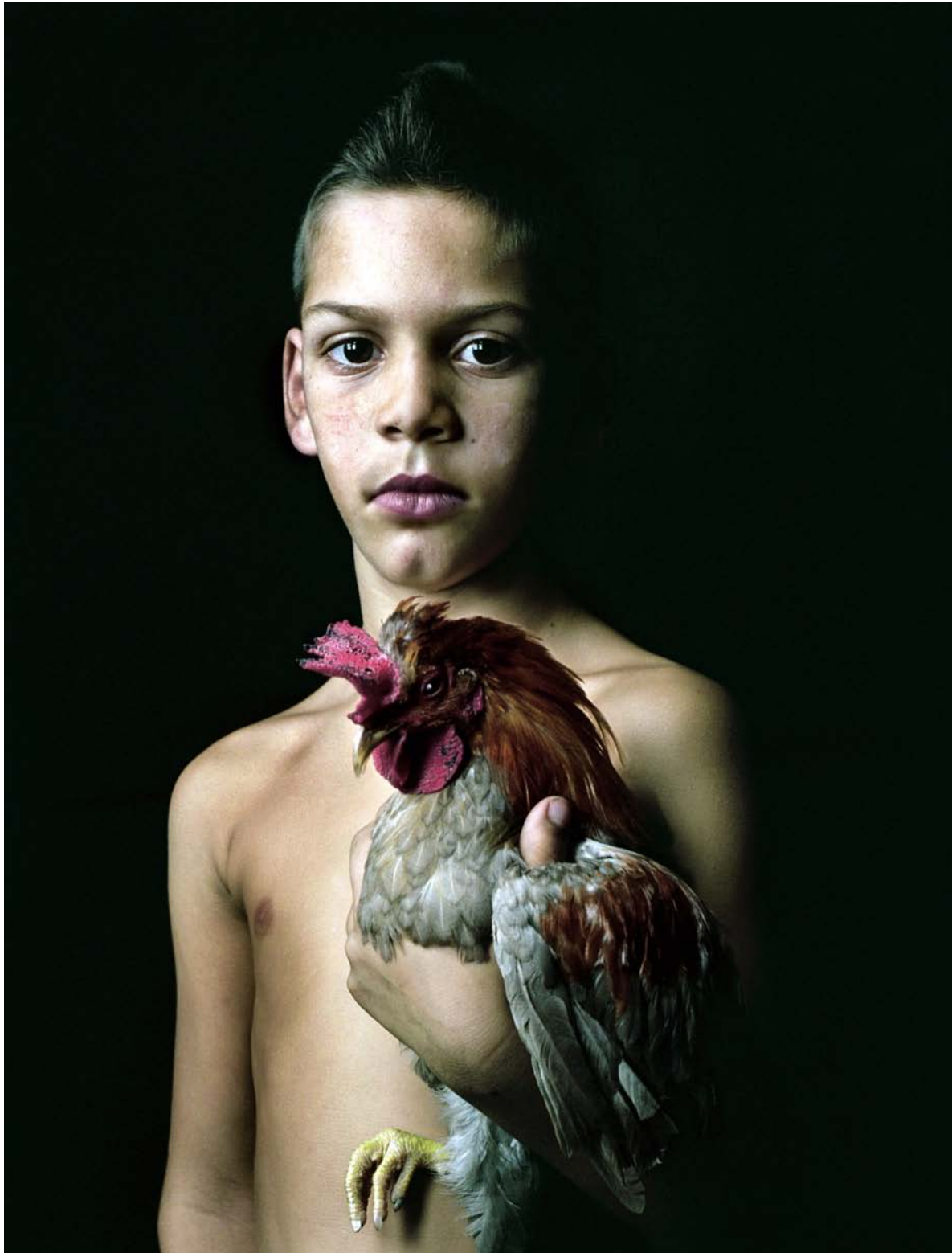
Pierre Gonnord, Moisés , 2007. Photographie analogique couleur, 165 x 125 cm.