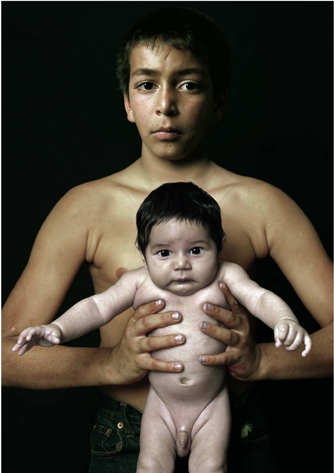
Pierre Gonnord, Los Montoya , 2008. Photographie analogique couleur, 175 x 125 cm.